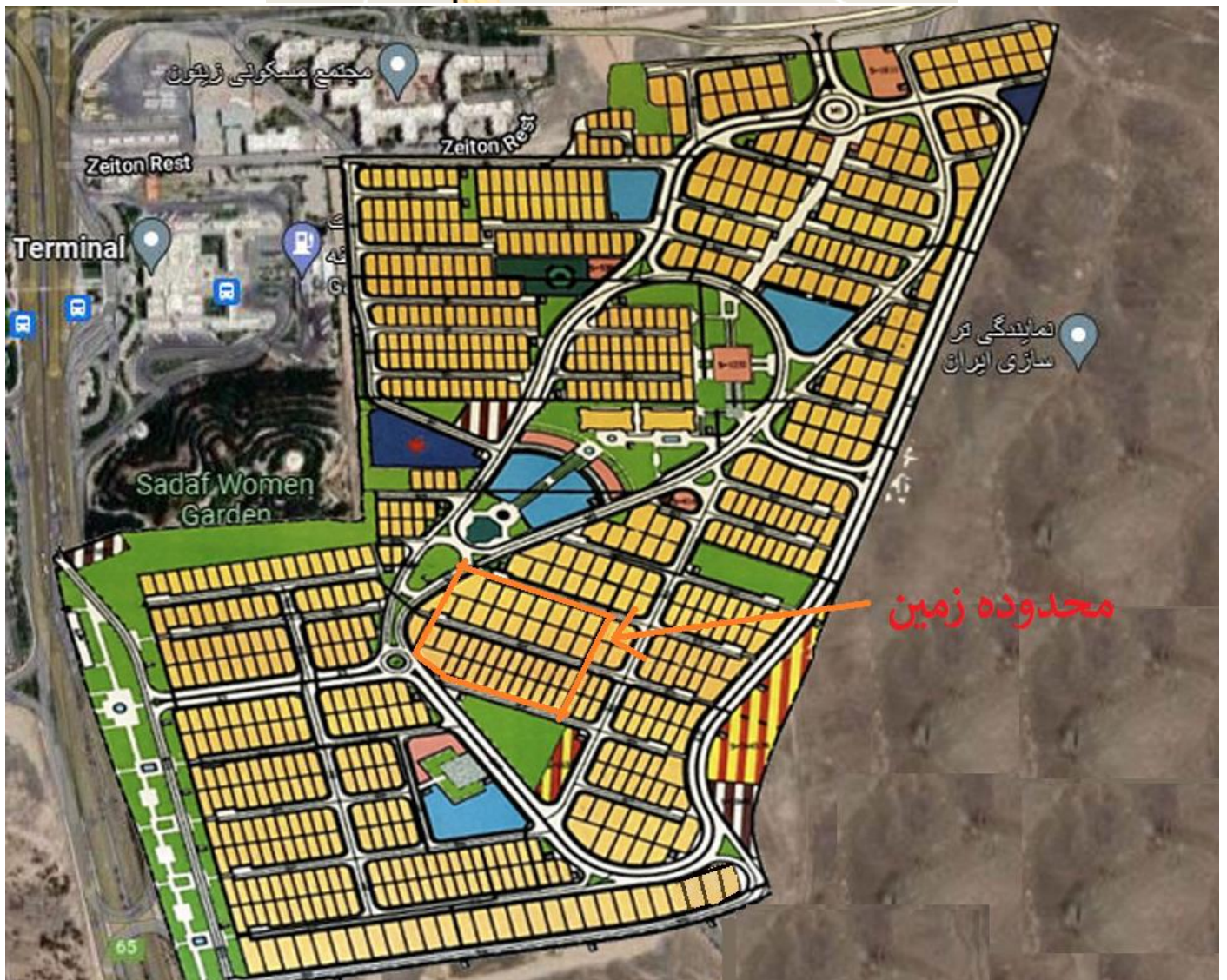
کروکی پروژه چشمه توتی